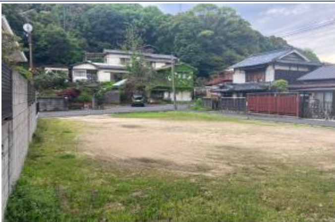
↑↑↑北東側より見た写真