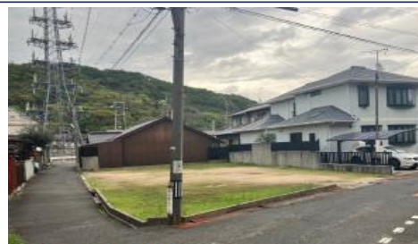
↑↑↑南西側より見た写真